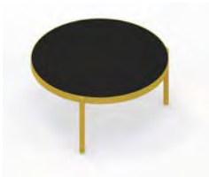
Mesa de centro 80 Ø