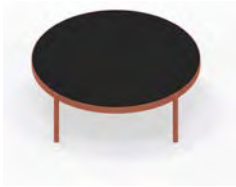
Mesa de centro 100 Ø