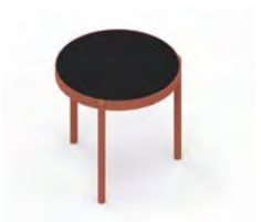
Mesa de centro 50 Ø