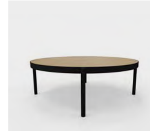
P13 Mesas de centro. Tapa roble. Estructura negra.