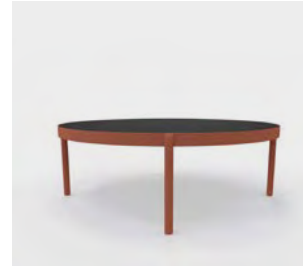
P12 Mesas de centro. Tapa lacada negra.