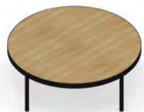
Mesa de centro 100 Ø