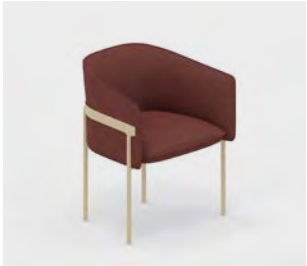
P9 Silla fija.