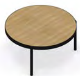
Mesa de centro 80 Ø