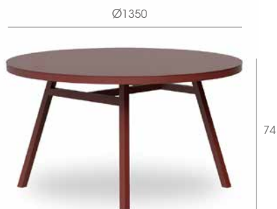
Table ronde pour une utilisation à l'intérieur et à l'extérieur. Structure en aluminium anodisé peinte au pistolet et séchée au four.

Round table for indoor and outdoor use. Powder coated anodized aluminium structure.